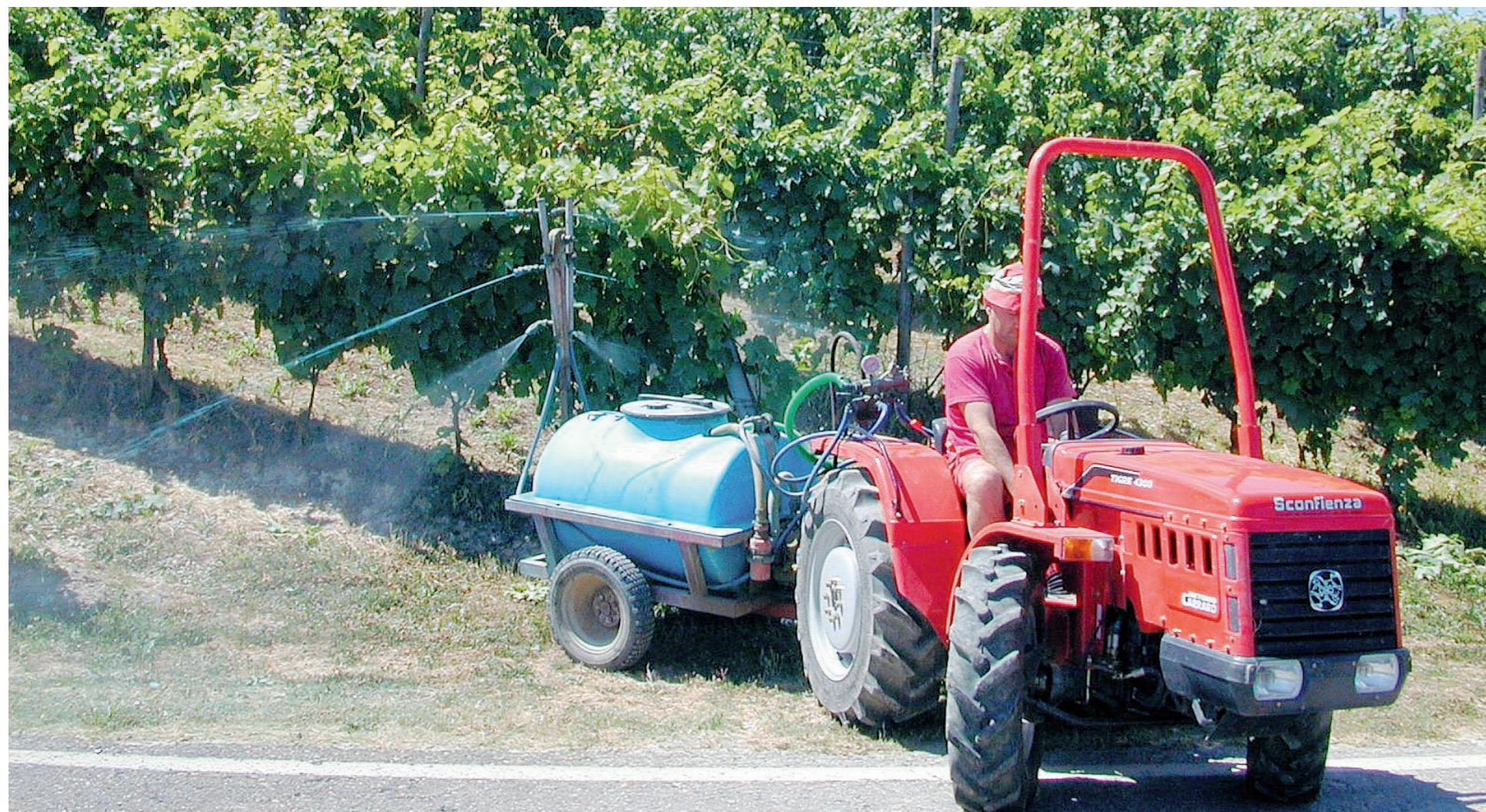
Nel Ravennate l'agricoltura rappresenta una realtà economica in grado di movimentare circa 400 milioni di euro

PROPOSTA DELLA COMMISSIONE UE IL PIANO 2020/2027