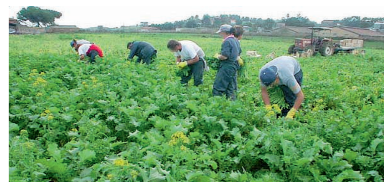
Lavoratori agricoli nei campi

Questo secondo Luchetta non esclude revisioni sulla modalità di erogazione dei contributi: «Pensiamo piuttosto a valorizzare chi dà lavoro, non diamo i soldi a un tot a ettaro. Premiamo chi