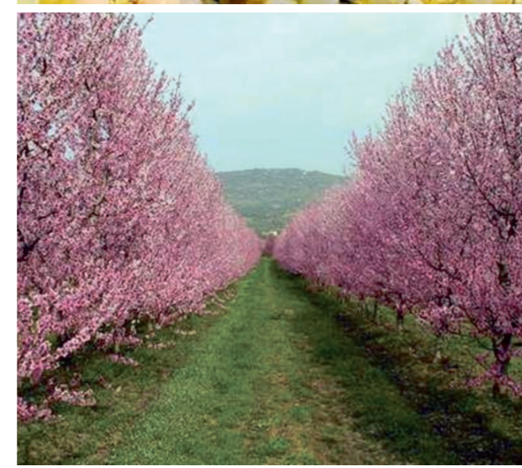
Sopra, la vendemmia, sotto, alberi in fiore in un frutteto